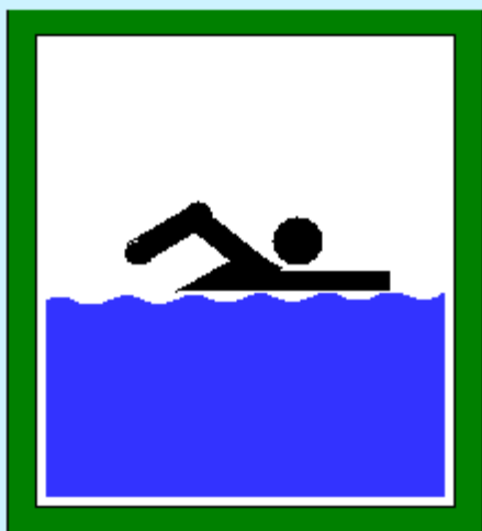
Место купания детей